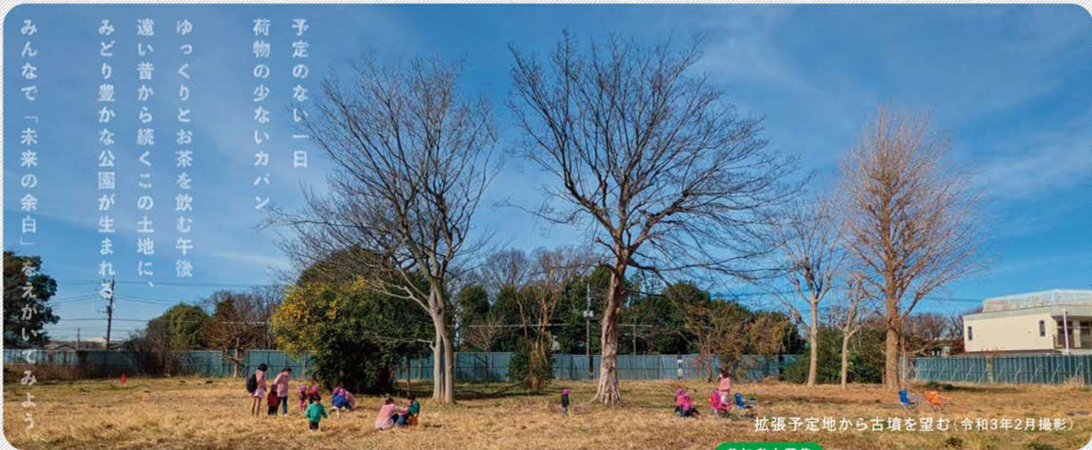
拡張予定地から古墳を望む(令和3年2月撮影)

みんなで「未来の余白」をえがいてみよう。 みどり豊かな公園が生まれる。 遠い昔から続くこの土地に、 ゆっくりとお茶を飲む午後 荷物の少ないカバン 予定のない一日